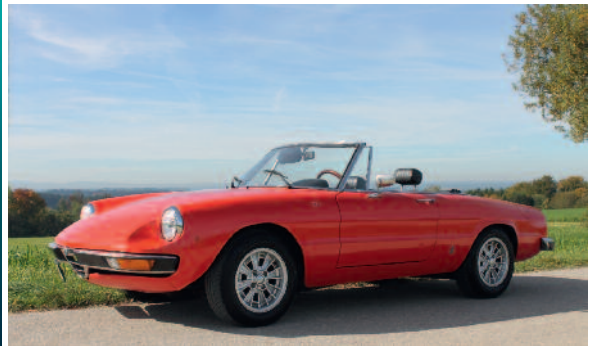
Ob am Walchensee oder vor einer Kapelle: Spider Emilio und unser Reporter machen stets eine gute Figur

einmal die etwas schwerere Lenkung und die Sache mit dem Zwischengas intuitus, kann ich mich, nicht zuletzt dank entspannter Reisegeschwindigkeit von 70 km/h (Sonntagsfahrer!), ganz dem Träumen hingeben. Weder Navi noch rechter Seitenspiegel noch Radio lenken ab. Sie existieren nicht. In Gedanken fahre ich Ende der 70er auf der Rückbank sitzend (vermutlich unangeschnallt) über den Brenner. Heute geht es über sanfte Hügel. Wieder unangeschnallt, was bei Oldtimern erlaubt ist. Das mag in puncto Verkehrssicherheit tönricht sein, in puncto Freiheitsgefühl ist es grandios. Und in puncto Zeitreise.